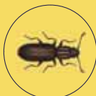
ORYZAEPHILUS SURINAMENSIS SILVANO

Chi è - Gli adulti di colore rossiccio sono lunghi 2,5-3,5 mm. Veloci camminatori solo raramente utilizzano le ali. Sul pronoto si evidenzia una grossa punteggiatura, tre carene longitudinali molto caratteristiche e una serie di 6 denti appuntiti su ogni lato. Cosa infesta - L'insetto è un classico detriticolo in grado di consumare residui e sfaldi di diversi cereali prodotti da rotture di tipo meccanico o biologico. Può attaccare anche pasta, biscotti, semi, frutta secca, cacao, caffè, tabacco.