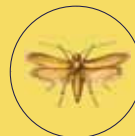
TINEOLA BISSELLIELLA TARMA DEI TESSUTI

Chi è - Questa farfalla di dimensioni ridotte ha un'apertura alare di 10-15 mm, con ali anteriori giallastre, quasi lucide, prive di macchie, e quelle posteriori grigie. Entrambe sono frangiate. La larva costruisce delicati tubi sericeo per protezione e riparo. Cosa infesta - Nell'ambiente naturale le forme giovanili frequentano nidi di uccelli e tane di piccoli mammiferi alla ricerca della cheratina contenuta in pelli, piume, pellicce. All'interno dei magazzini invece possono attaccare indumenti, cuscini e materassi di lana, stoffe, pellicce non trattate, tappeti, pennelli, spazzole, collezioni entomologiche dei musei. Non è raro osservare infestazioni relative alla parte esterna dei salumi in stagionatura.