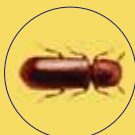
RHIZOPERTHA DOMINICA CAPUCCINO DEI CEREALI

Dome Trap STGB / MGB | Re-Bait STGB / MGB | WB Probe II