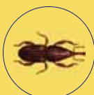
SITOPHILUS ORIZAE PUNTERUOLO DEL RISO

Dome Trap CFB / RFB | Re-Bait CFB / RFB | Feromone CFB / RFB | WB Probe II