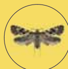
NEMAPOGON GRANELLA FALSA TIGNOLA DEL GRANO

Thidine | IMM + 4 Stargard II | Bucket Trap | Squeeze & Snap Trap | Feromone IMM + 4