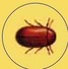
LASIODERMA SERRICORNE TARLO DEL TABACCO

Thidine | IMM + 4 Stargard II | Bucket Trap | Squeeze & Snap Trap | Feromone IMM + 4