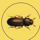
TRIBOLIUM SPP. TRIBOLIO

Chi è - Le due specie presenti nelle aziende alimentari, Tribolium confusum e Tribolium castaneum , sono molto simili fra loro e presentano una colorazione rossastra. Sono lunghi 4-5 mm. Le larve, più chiare, sono particolarmente mobili e, dopo 6-8 mute, raggiunta la maturità, si muovono verso la superficie del substrato alimentare per impuparsi. Il ciclo biologico completo si svolge in 7-12 settimane. L'adulto può vivere fino a 3 anni. Cosa infesta - L'insetto preferisce le cariossidi di cereale già spezzate e danneggiate. Attacca anche farine, semole, semi, spezie, frutta secca. Gli adulti sono muniti di ghiandole che secernono una sostanza dall'odore disgustoso, determinando un progressivo deprezzamento delle derrate infestate.