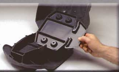
Vaschetta usa e getta per la manutenzione

Il Leader Mondiale nella Tecnologia della Derattizzazione