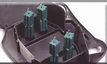
Contiene fino a otto blocchi da 28 g