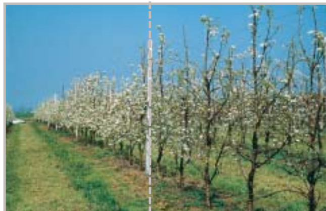
Parcella non trattata

Aliette ® , inserito in un opportuno piano di trattamenti, previene la necrosi delle Gemme del Pero.